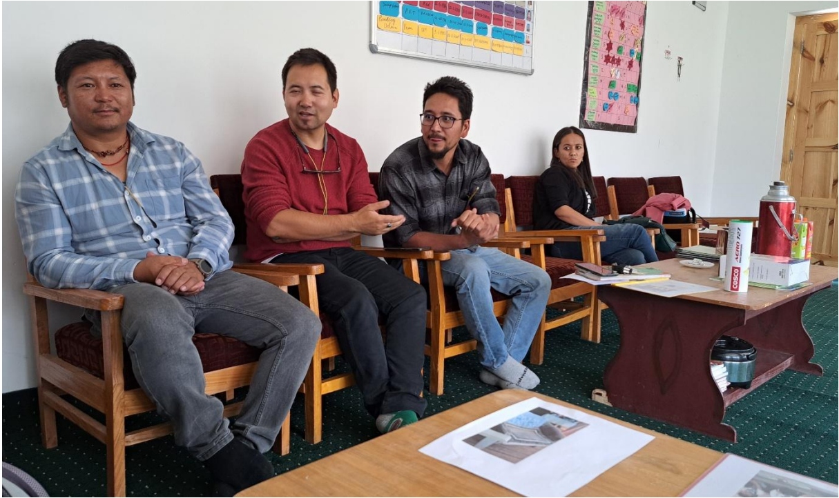
Meeting mit den Verantwortlichen in Nimoo