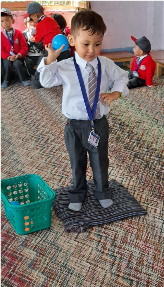
Konzentrierte Aufmerksamkeit !