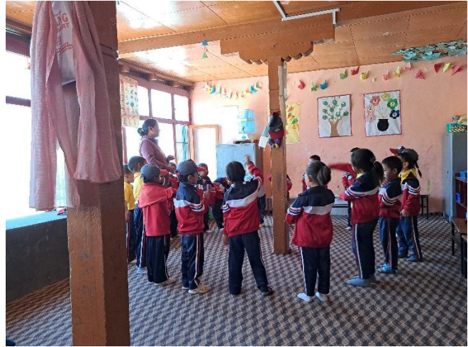
Nursery Nimoo (vierjährige Kinder)